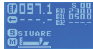
전체용지 길이 균등재단 할 용지 길이

재단 치수값을 설정하여 재단시 설정값에 맞춰 페이퍼가이드가 자동으로 설정됩니다.