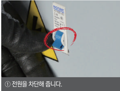
① 전원을 차단해 줍니다.