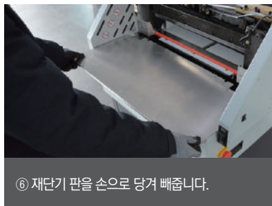
⑥ 재단기 판을 손으로 당겨 빼줍니다.