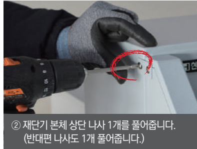
② 재단기 본체 상단 나사 1개를 풀어줍니다. (반대편 나사도 1개 풀어줍니다.)