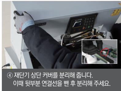
④ 재단기 상단 커버를 분리해 줍니다. 이때 뒷부분 연결선을 뺀 후 분리해 주세요.