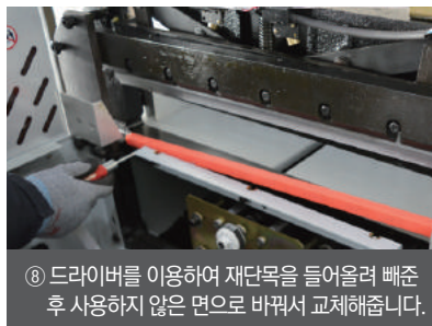
⑧ 드라이버를 이용하여 재단목을 들어올려 빼준 후 사용하지 않은 면으로 바꿔서 교체해줍니다.