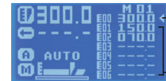
전체용지 길이 용지재단 사이즈