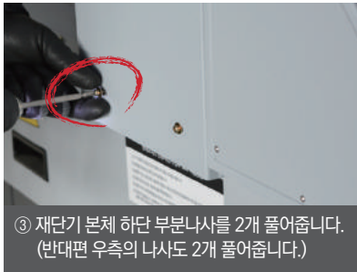
③ 재단기 본체 하단 부분나사를 2개 풀어줍니다. (반대편 우측의 나사도 2개 풀어줍니다.)