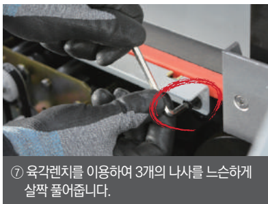
⑦ 육각렌치를 이용하여 3개의 나사를 느슨하게 살짝 풀어줍니다.